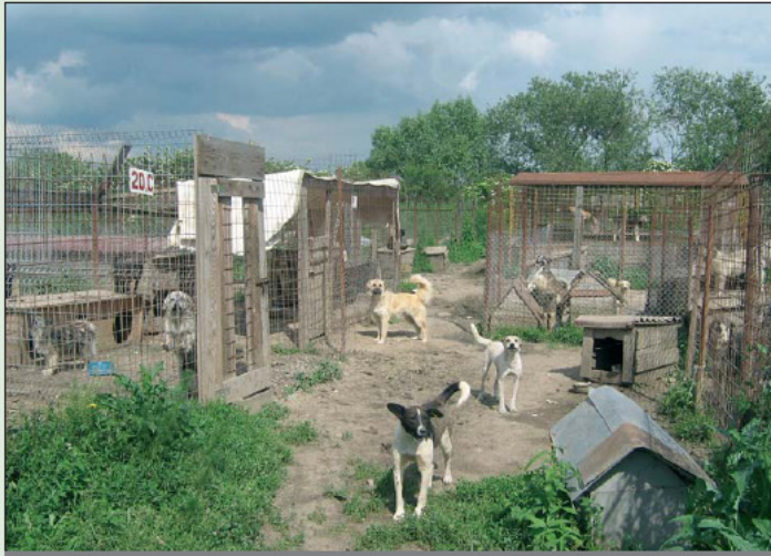
Tierschutz unter schwersten Bedingungen: überfülltes Tierheim Suceava

WIE EINE BAYERISCHE ÄRZTIN UM DAS ÜBERLEBEN VON